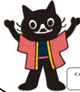
イメージキャラクター ネコストくん

「NEXT LEADER」をお読みいただくためには、「NEXT CLUB」にご入会いただく必要があります。 会員限定のウェブサイトから経営に役立つシートのダウンロード。セミナーにも優先的にご参加いただけます。