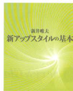
『新アップスタイルの基本』 A4変型判・164ページ 定価 5,500円(税込)