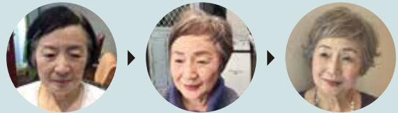
グレイッシュヘアは1回の施術で完成させるのではなく、髪の履歴に応じて1年以上かけて移行するもの。本書では顧客の実例を元に移行のノウハウを詳解。

オトナの高明度カラーで明るく健康的にベタ塗りをやめるから髪・頭皮すこやかにパーマやヘッドスパなどトータル提案で単価アップ