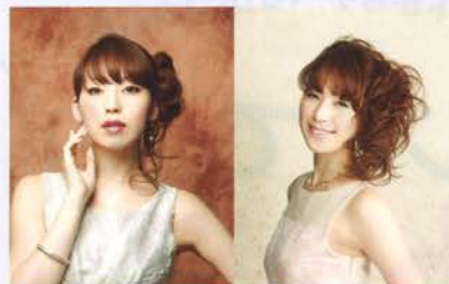
サイドアップランダム ルーズカール